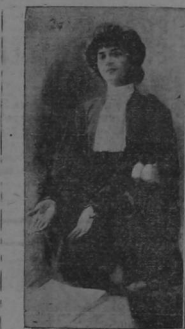
ANA HOWARD SHAW

WASHINGTON, 4.—4,400 sufragistas que en la inauguración de la nueva Presidencia iniciaron anoche una procesion, fueron atacadas por el populacho que les interrumpió la procesion insulstantos, cortándoles las fias y atropellándolas. La política, insuficiente, no cumplió con